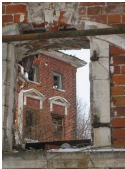
ГЛАВНЫЙ ФАСАД. ФРАГМЕНТ