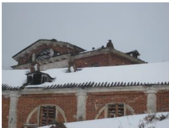
БОКОВОЙ ФАСАД, ФРАГМЕНТ