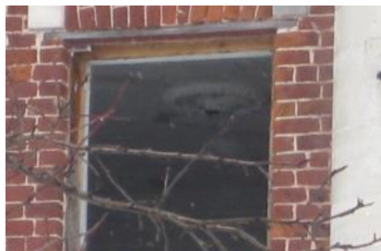
ФРАГМЕНТ ИНТЕРЬЕРА. РОЗЕТКА