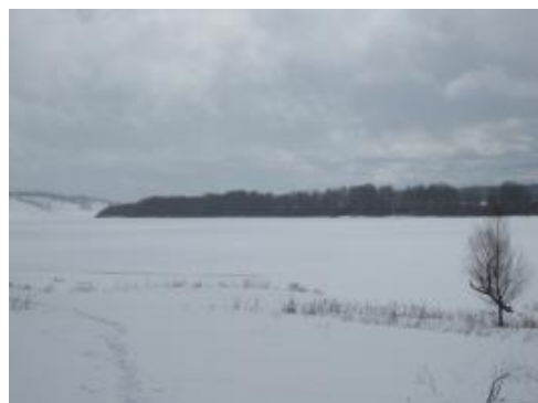
ВИД от ДОМА