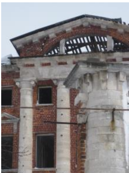
ГЛАВНЫЙ ФАСАД. ФРАГМЕНТ