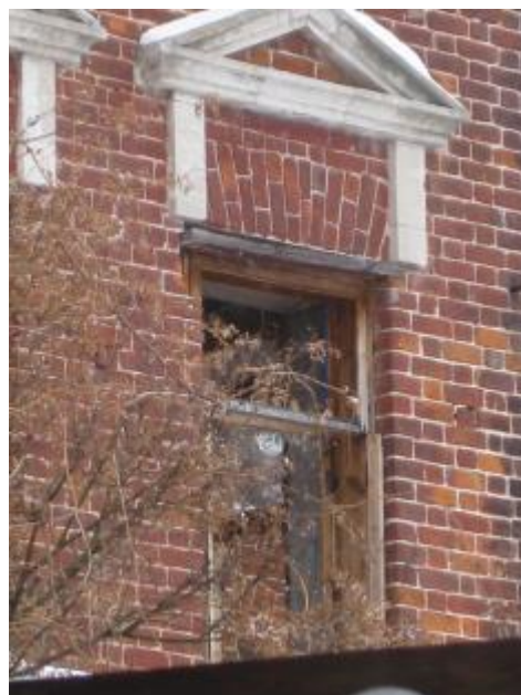
ГЛАВНЫЙ ФАСАД. ОКНО