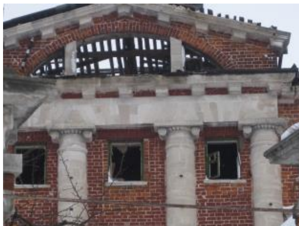
ГЛАВНЫЙ ФАСАД, ФРАГМЕНТ