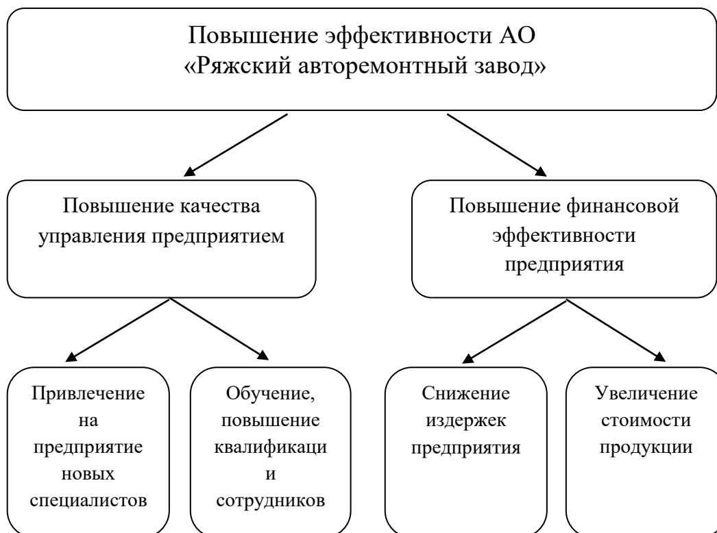
Рисунок 3 – Фрагмент дерева целей

Рассмотрим эти расчеты на примере построения дерева целей для конкретного предприятия (рисунок 3).