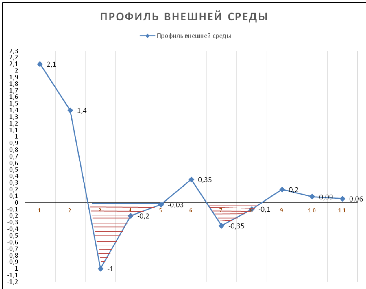
Рисунок 2 – График профиля внешней среды