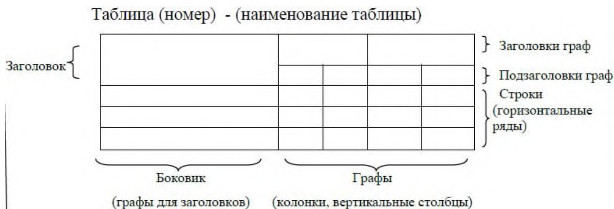
Рисунок 2 – Структура таблицы и её основные составляющие

В левом верхнем углу над таблицей помещают надпись «Таблица» с указанием ее номера последовательно арабскими цифрами кеглем 14 пт. Номер таблицы должен состоять из двух чисел: номера раздела и порядкового номера таблицы в разделе, разделенных точкой. Далее, после надписи «Таблица» ставится тире и с заглавной буквы пишется ее название, которое должно отражать ее содержание, быть точным, кратким. После названия таблицы точка не ставится.