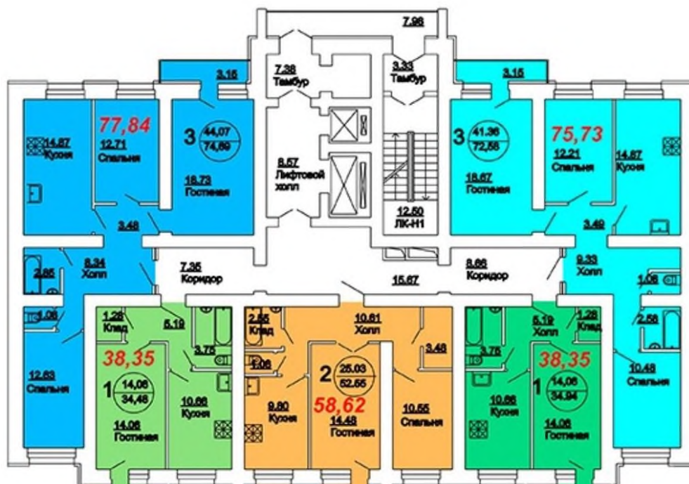
Рисунок 1 – Планировка квартир

Дайте характеристику проекта строительства пятиэтажного жилого дома. Планировки квартир представлены на рисунке 1. Заполните таблицу 9.